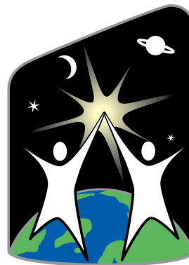
Offizielles Logo der World Space Week

Als deutscher Koordinator für die World Space Week 2010 schlage ich allen Unternehmen und Organisationen, die sich in Deutschland mit Raumfahrt beschäftigen, vor, die Woche ab dem 4. Oktober frühzeitig - vielleicht auch für die Folgejahre - im Kalender rot anzustreichen .